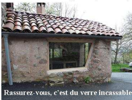
Rassurez-vous, c'est du verre incassable