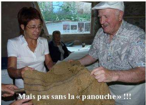
Mais pas sans la « panouche » !!!