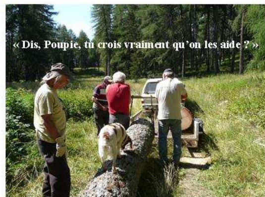
« Dis, Poupie, tu crois vraiment qu'on les aide ? »